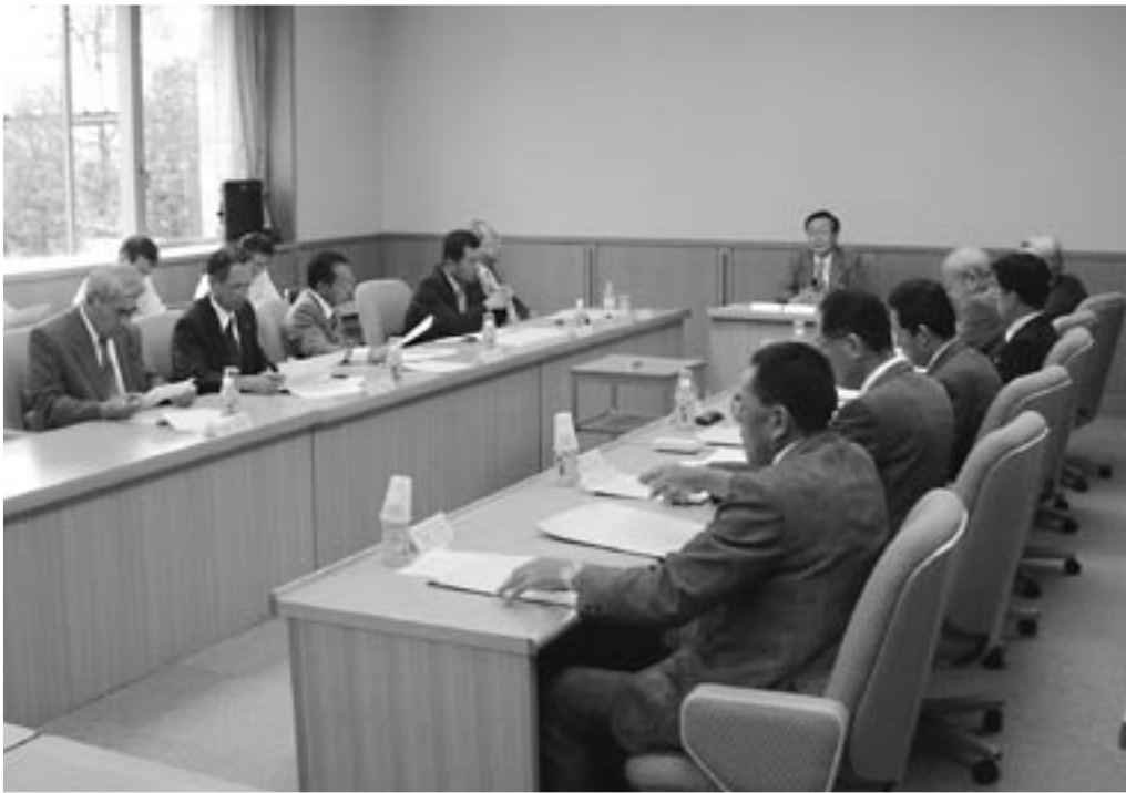
▲7月24日にサンアリーナで開催した検討会議