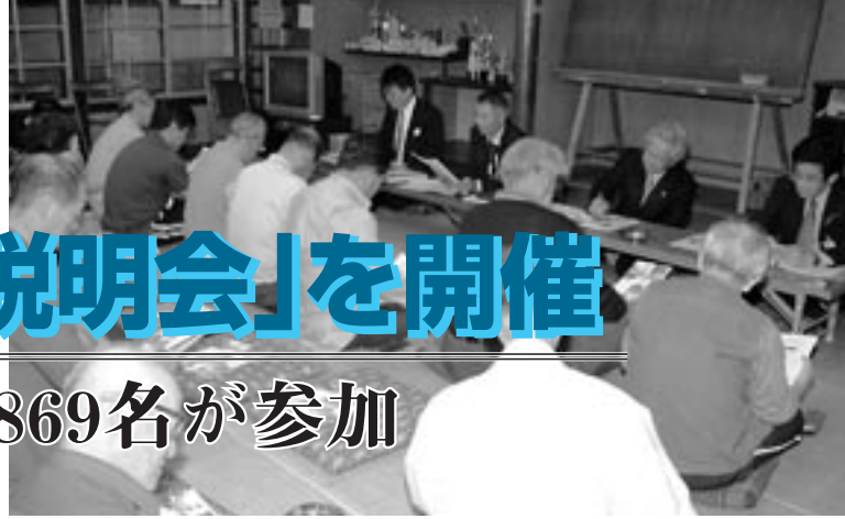
▲伊勢市「宮後公会堂」での説明会

住民の皆さんに市町村合併への理解をより深めていただくため、5月から7月にかけて、伊勢市、二見町、小俣町、御園村がそれぞれで「市町村合併住民説明会」を開催しました。