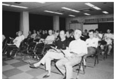
▼御園村「新開公民館」での説明会

ので、メリットばかりでなく、デメリットもある。その難問を調整した合併推進を望む。